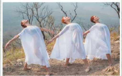
Os espetáculos "Terra Sem Mali" (Cia. de Dança do Pantanal), "R.U.A." (Dança Urbana) e "Têrmino" (Luzmia Cia. de Dança) estão na programação do Festival Dança Três. FERNÃO CAPELO

OFICINAS As oficinas do Festival Dança Três serão realizadas, das 14h às 16h, na sexta-feira e no sábado. A residência artística, de sexta-feira a domingo em diferentes horários. As ações de formação acontecem no Departamento de Cultura da Secretaria Municipal de Educação e Cultura de Três Lagoas, que apoia o evento. O Dança Três é uma iniciativa da produtora Arado, bancada por recursos do Fundo de Investimentos Culturais de Mato Grosso do Sul (FIC/MS). Mais informações nas redes sociais e no blog http://festivaldanca3.blogspot.com/ .