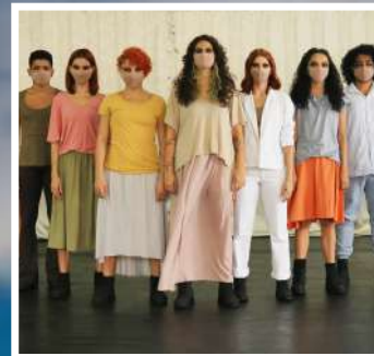
CARNE QUEBRADA COREÓGRAFO: WELLIGTON JULIO CRIAÇÃO EM 2019