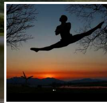
GUADAKAN COREÓGRAFO: CHICO NELLER CRIAÇÃO EM 2022