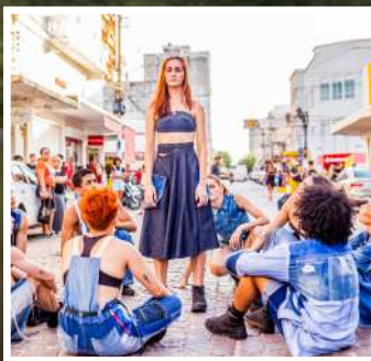
MIGRANTES COREÓGRAFO: WELLIGTON JULIO CRIAÇÃO EM 2022