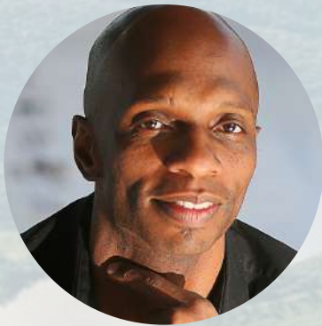
RUI MOREIRA Bailarino, Coreógrafo e Pesquisador

Bailarino, coreógrafo e pesquisador, ícone da arte e da cultura brasileira. Dançou na companhia Cisne Negro (SP), Balé da Cidade de São Paulo (SP), Cia. Azanie (França) e no Grupo Corpo (MG), onde permaneceu como integrante durante 14 anos e estabeleceu uma relação de figura icônica da dança brasileira. Montou coreografia para vários moldes de dança, teatro, cinema e televisão, e atualmente está dirigindo a Rui Moreira Cia de Danças, onde leva a cabo investigações, coletivas e projetos individuais. Foi agraciado com a medalha da Inconfidência pelo governo do Estado de Minas Gerais, um merecido reconhecimento pelas atividades artísticas e sociais em todo território brasileiro.